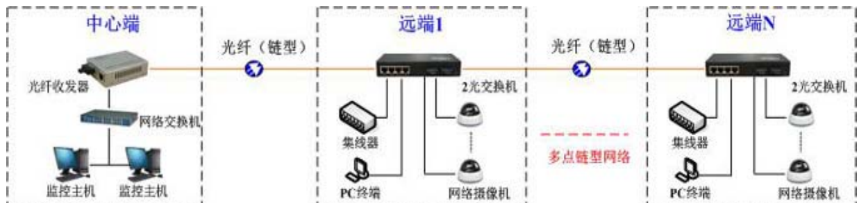
方案一：光纤多点组链型网络